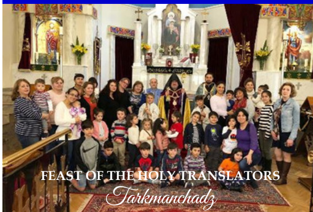
FEAST OF THE HOLY TRANSLATORS Tarkmanchadz