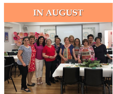
Sunday 18 August ACLA St Mary's Day Luncheon

SUPPORT OUR CHURCH YOUTH in celebrating GOMIDAS VARTABED on his life and contribution to our culture, heritage and religion